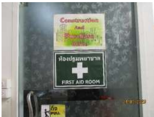
รูปที่ 28 ห้องปฐมพยาบาล