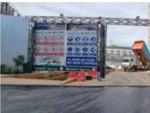
รูปที่ 19 ป้ายความปลอดภัย