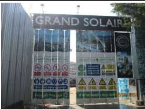
รูปที่ 2 ประตูทางเข้า-ออกโครงการปิดมิดชิด