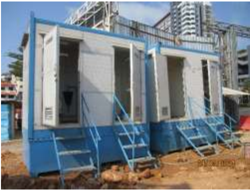
รูปที่ 6 ห้องน้ำ-ห้องส้วม