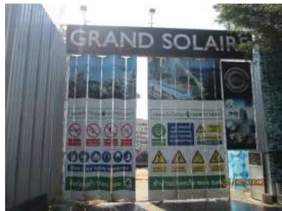
รูปที่ 8 ไฟส่องสว่างบริเวณพื้นที่โครงการ