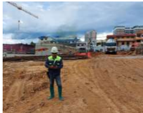
รูปที่ 24 SAFETY