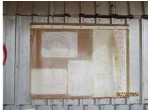
รูปที่ 12 ห้องสไตร์