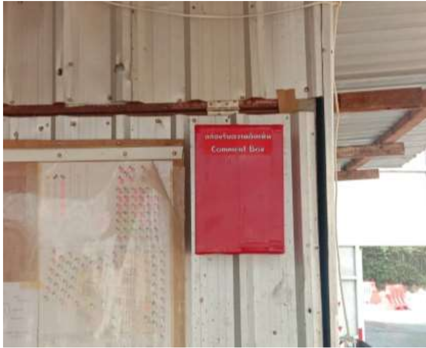
รูปที่ 26 กล่องรับความคิดเห็น