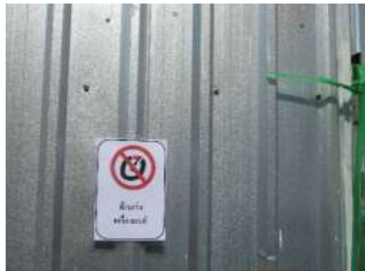
รูปที่ 10 ป้ายห้ามเร่งเครื่อง