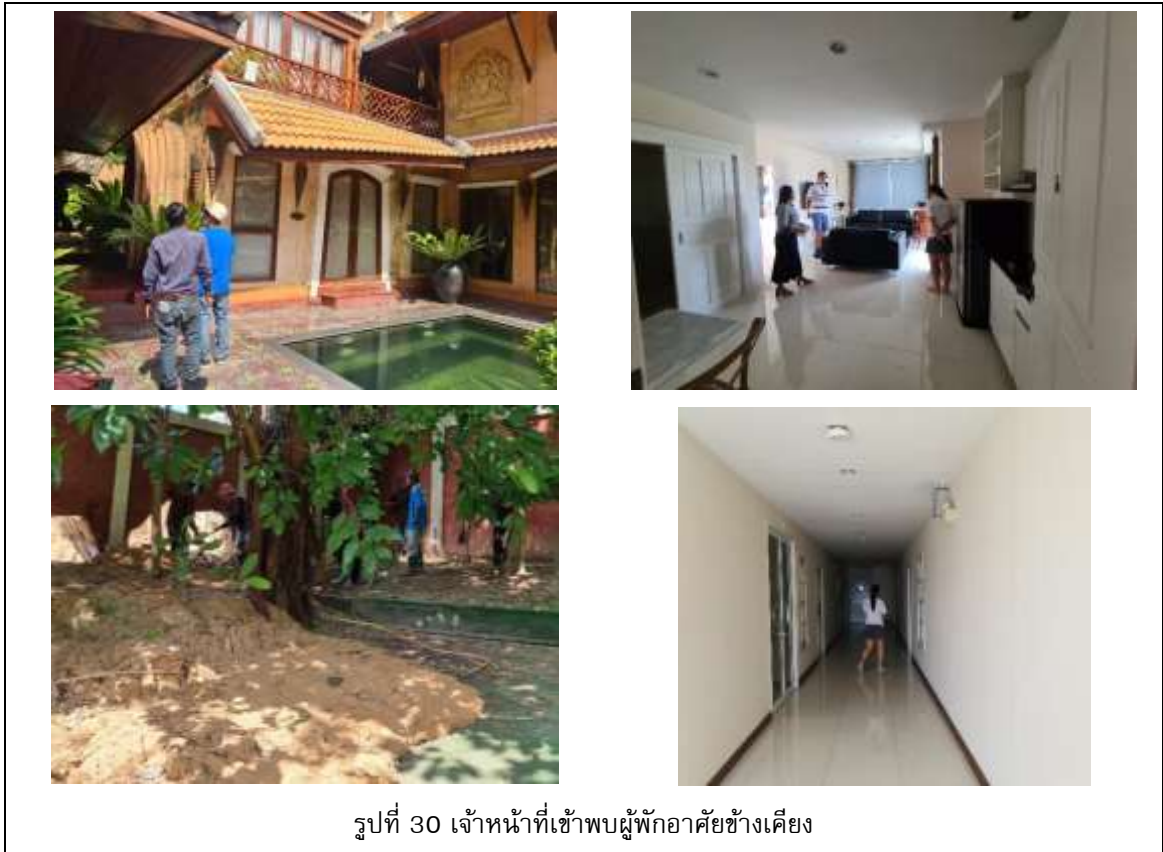
รูปที่ 30 เจ้าหน้าที่เข้าพบผู้พักอาศัยข้างเคียง