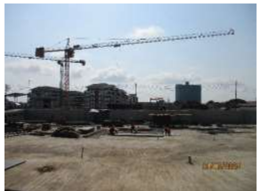
รูปที่ 25 สภาพโครงการ ณ เดือนมีนาคม พ.ศ.2566