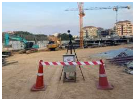
รูปที่ 21 ตั้งเครื่องตรวจวัดคุณภาพสิ่งแวดล้อม คุณภาพอากาศ ระดับเสียง เสียงรบกวน ความสั่นสะเทือน