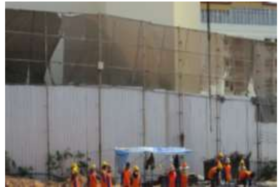
รูปที่ 1 รั้ว Metal Sheet รอบพื้นที่โครงการ