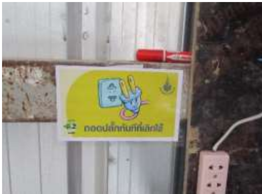
รูปที่ 14 ป้ายรณรงค์ประหยัดไฟ