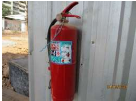
รูปที่ 7 ถังดับเพลิง