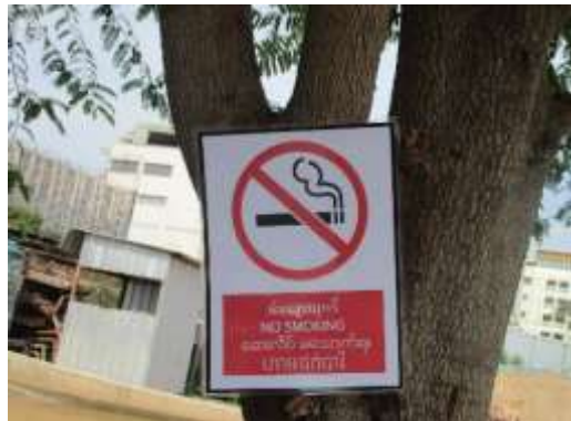
รูปที่ 15 ป้ายห้ามสูบบุหรี่