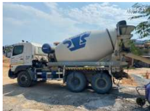
รูปที่ 20 รถผสมปูนสำเร็จรูป