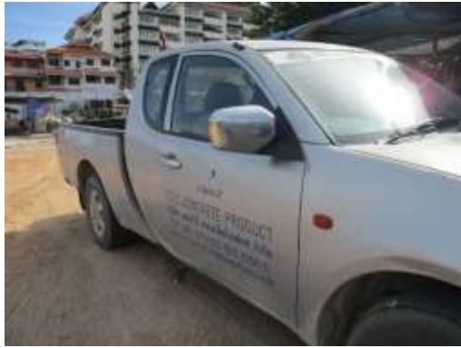
รูปที่ 22 ป้ายแสดงชื่อและหมายเลขโทรศัพท์ติดต่อ