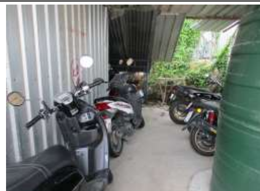
รูปที่ 4 พื้นที่จอดรถภายในโครงการ