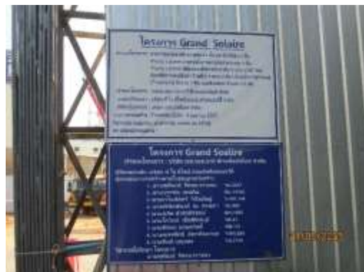
รูปที่ 29 บ้ายรายละเอียดโครงการ