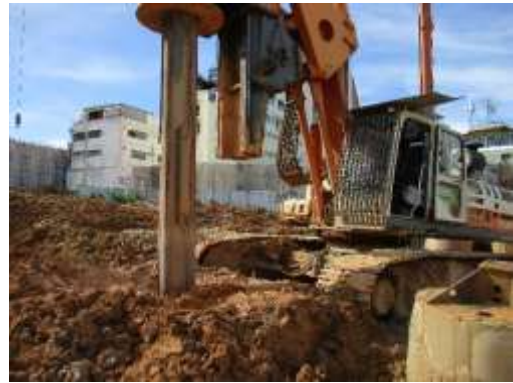
รูปที่ 18 เจาะเสาเข็ม