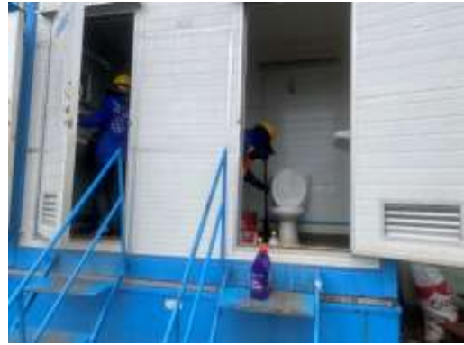
รูปที่ 23 คนงานล้างทำความสะอาดห้องน้ำ