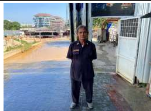
รูปที่ 3 เจ้าหน้าที่รักษาความปลอดภัย (รปภ.)