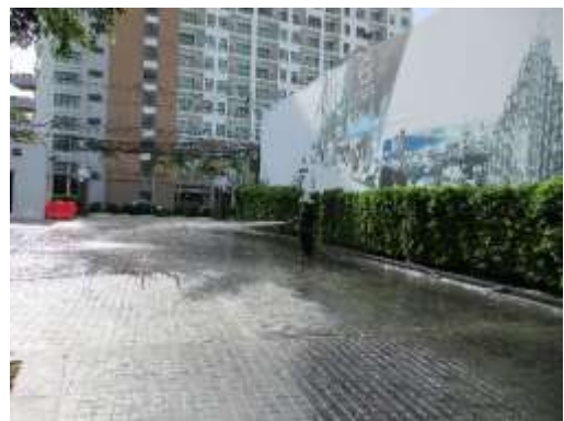
รูปที่ 13 คนงานฉีดพรมน้ำบริเวณด้านหน้าโครงการ