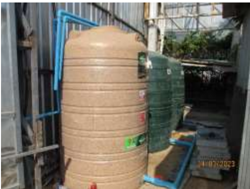
รูปที่ 9 ถังเก็บน้ำสำรอง