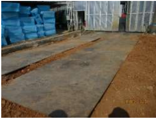
รูปที่ 17 แผ่นเหล็ก