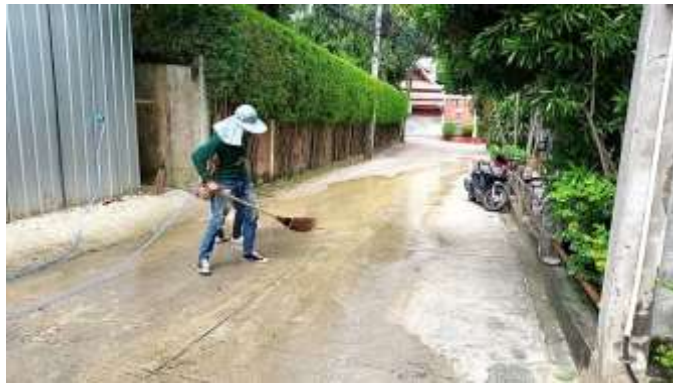
รูปที่ 27 เจ้าหน้าที่ล้างทำความสะอาดถนนด้านหน้าและด้านข้างโครงการ